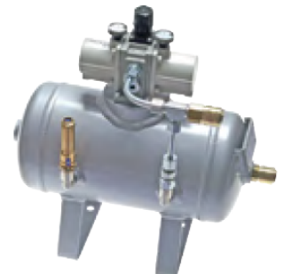
Typ DUE 60 B5