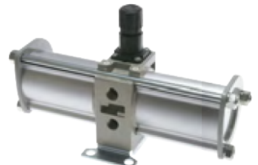
Typ DUE 1000 A

Schalldämpfer und Manometer bitte separat bestellen!