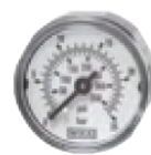
Typ MW 2527