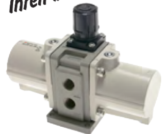
Typ DUE 230 A

Problemlöser! So verdoppeln Sie Ihren Betriebsdruck.