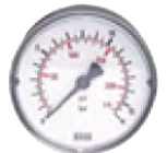
Typ MW ... 40

Komplett verrohrt mit Druckluftbehälter und Manometern (Anschluss über Schnellkupplung NW 7,2)