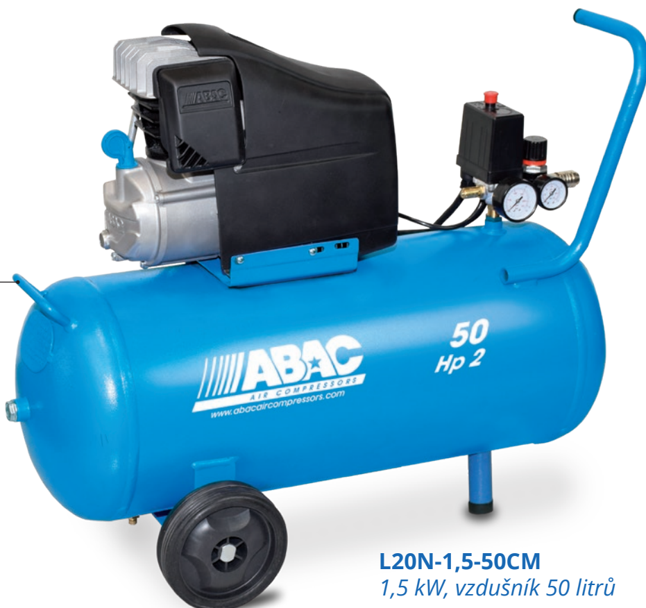
L20N-1,5-50CM 1,5 kW, vzdušník 50 litrů

Pohodlná manipulace díky přidanému madlu na tlakové nádobě