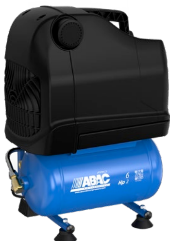
OSS20P-1,5-6RM 1,5 kW; vzdušník 6 litrů

Bezolejové profesionální kompresory s přímým pohonem v přenosném a mobilním provedení určené pro menší řemeslnické aplikace.