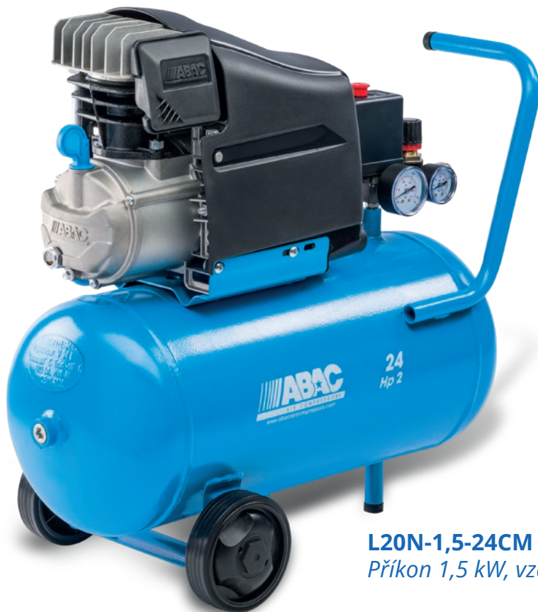
L20N-1,5-24CM Příkon 1,5 kW, vzdušník 24 litrů