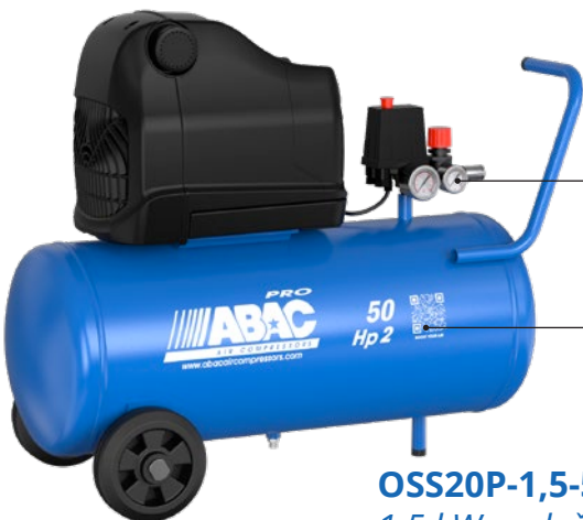
OSS20P-1,5-50CM 1,5 kW; vzdušník 50 litrů