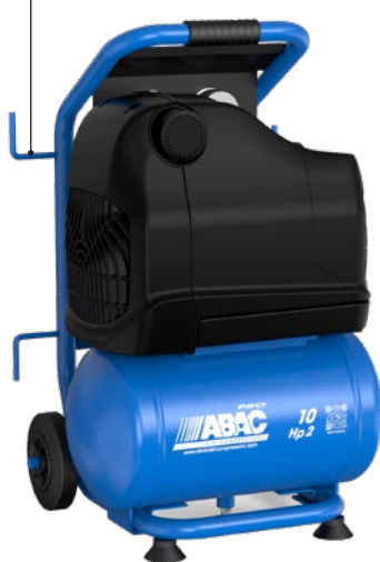
OSS20P-1,5-10RM 1,5 kW; vzdušník 10 litrů

Praktické háčky pro zavěšení kabelů a hadic