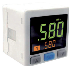
Tlakové spínače RL3