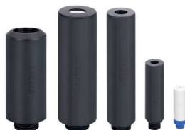
Tlumiče hluku ZSA