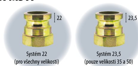
Systém 22 (pro všechny velikosti)