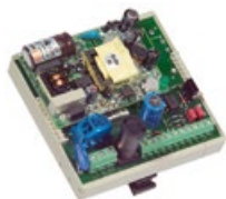
Napájecí jednotka pro montáž na DIN lištu