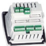
Napájecí jednotka pro montáž na zeď