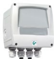
Napájecí jednotka pro montáž na zeď